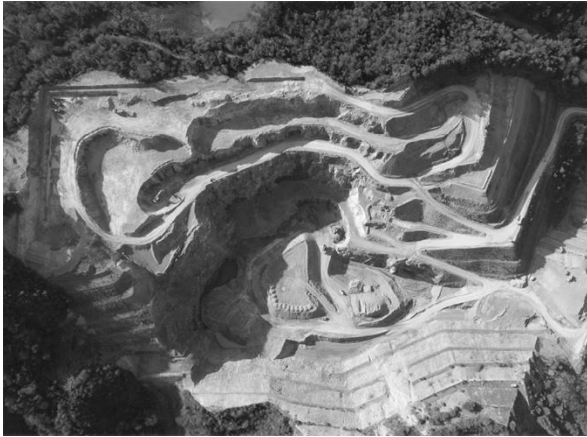
図3 海拔高度870m・地表高度500m

っては、まずはドローンに搭載されたカメラで場内を点検（映像確認）をすることで、作業員の安全確保にも繋がる。（図3：採掘場全景）