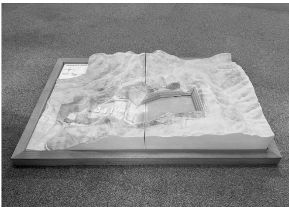
図4 3D模型（大きさA2サイズ）

周辺の地形を含む工場全体の地形測量を行い、点群データを基に3D模型（図4：3D模型）を製作し、ドローンに搭載されたカメラの映像と合わせて確認することにより、詳細な位置情報及び現況確認が迅速にできる。